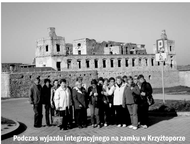
Podczas wyjazdu integracyjnego na zamku w Krzyżtoprze

W ostatnim okresie (4 ubiegłe. lata) nasza aktywna działalność została, z powodów od nas niezależnych, poważnie ograniczona. Powodem tego było rozwiązanie przez Urząd Gminy umowy o użyczenie dla SWNW lokalu pod działalność statutową w świetlicy wiejskiej, a w późniejszym terminie wyburzenie w/w świetlicy pod planowaną budowę drogi szybkiego ruchu DK 42. Prowadzone próby udostępnienia miejsca dla SWNW w obiekcie gminnym na terenie sołectwa (Szkoła Podstawowa!) do dzisiaj, niestety, nie powiodły się. Ten temat pozostawiam bez dalszego komentarza! Jako SWNW zostaliśmy sami z problemem lokalowym i nie mając dostatecznych środków własnych (dochód SWNW to składki członkowskie!) na wynajem, korzystamy sporadycznie z uprzejmości i pomieszczeń Pana Jana